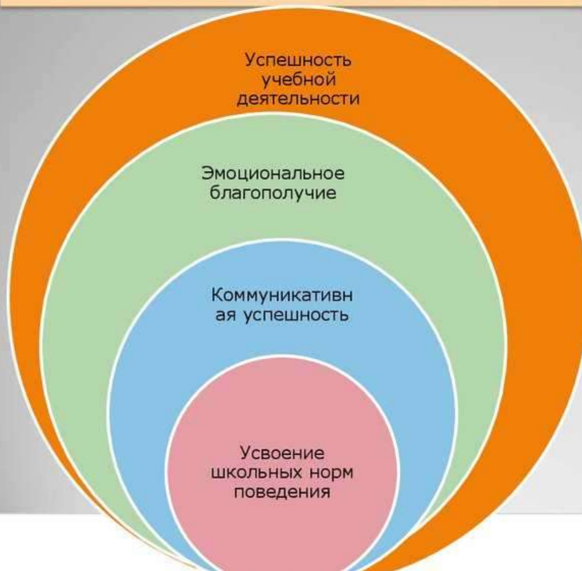
Схема социально-психологической адаптации школьника